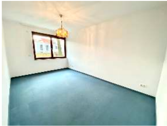
Schlaf-, Kinder- oder Arbeitszimmer